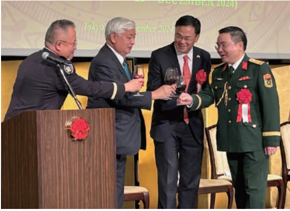
互いにグラスを交わす中谷大臣とヒエウ駐日大使、ベトナムの軍関係者

ベトナム人民軍創設80周年、全人民国防の日35年記念式典が東京都港区元赤坂の明治記念館で開催され、ベトナム大使館、防衛省、世界各国の防衛関係者300人近くが集まりました。