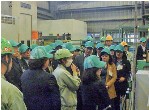
ベトナム人従業員が工場内を案内

フォージテックカワベ株式会社は最新の設備導入や作業効率の改善に積極的に取り組み、高精度・高品質な鍛造技術のさらなる向上を目指し、鍛造品の製造から加工、品質管理、納品まで一貫体制で行っている会社です。