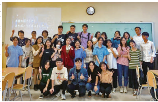
交流に参加した、日本語学課の学生たち

1時間半程度の活動は、常に笑い声や歓声が上がるほど打ち解けた雰囲気で行うことができました。