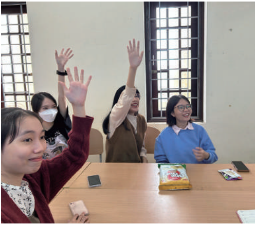
盛んに交流に参加する学生たち

それでも学生は諦めずに言葉に表せないほど熱心に日本語で話しかけてくれました。『出来ないから諦める』のではなく『出来ないなら出来ないなりに