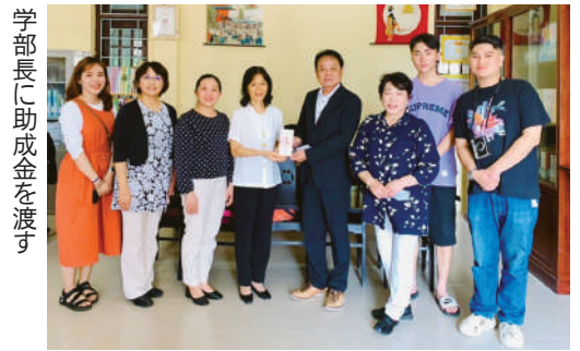
学部長に助成金を渡す

とって今回のように訪問いただき、直接日本語の会話ができる機会はとても重要です」との言葉を伝えてくれました。