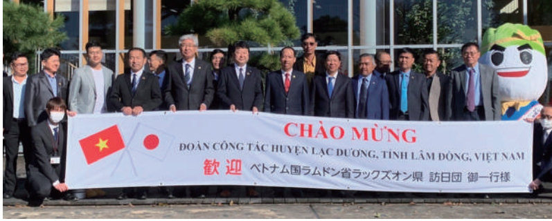
ラックスオン県の人民委員会一行と八千代町の職員、右は八千代町イメージキャラクターの八菜丸(はなまる)

2023年は、日本とベトナムとの外交関係樹立50周年を迎えます。 50周年を前に、友好協会会員の八千代町とベトナムのラックスオン県が10月26日、友好都市提携協定を締結しました。