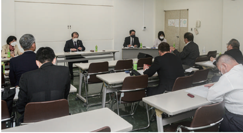
各議案に対し意見交換をする理事

友好協会はNPO法人格を取得し新たなスタートを切りましたが、今後は寄付者が税制優遇を受けられるよう、まずは特定認定NPO法人として、後に認定NPO法人への移行を目指すこ