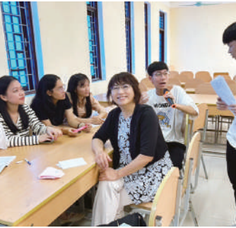
食文化について話し合う

今回の訪問では、かつて茨城大学に交換留学生として来ていた元学生たちの協力を得て、滞りなく日程を進めることができました。