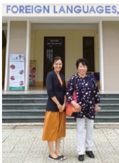
フエ外大の前で久しぶりに会うラン先生たち

会と大学との交流締結の際や、今回の訪問にも力を注いでくれた方で、現在でも会員との交流が続いており、留学生との交流の先駆けとなっております。