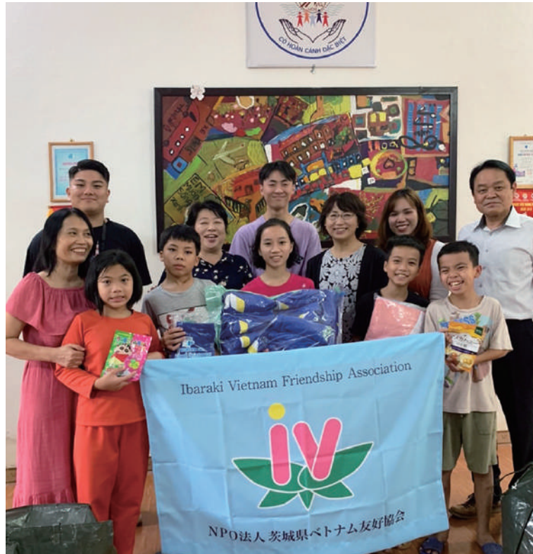
久しぶりの再会に喜ぶ児童福祉施設の子供たち

鈴縫工業株式会社（日立市）の創業百周年記念事業「おひさまの恵みプロジェクト」の助成を受けた「茨城とベトナムをつなぐ青少年交流プロジェクト」は11月23日〜27日までの5日間の日程で、ベトナムを訪問し、アンタイ子どもの家とフエ外国語大学で支援活動や交流活動を行うなど、友好親善を深める交流をしてみました。