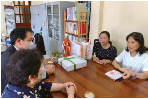
チャー学部長、ニー先生と事務局

大学事務所内での懇談でチャー学部長は「この3年間は新型コロナウイルス感染症の影響を受け、リモートによる授業が主体でした。その結果、学生の日本語に対する関心が弱まっているように見られるとともに、語学力の低下が現れています。対面での授業が再開されましたが、学生に