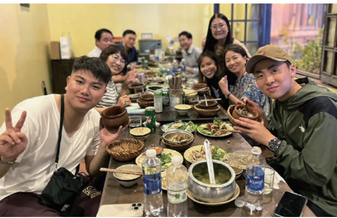
ベトナムの伝統料理をみんなで味わう

今回のベトナム訪問では日本では感じられない事を沢山感じられたとてもいい経験になりました。この経験を今後の人生の生きる活力にしていきたいです。