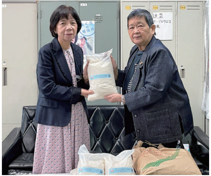
西蓮寺会長(右)と山口理事長

県内で広くボランティア活動を行っている茨城県女性つばさ連絡会を通して10月19日、公益社団法人茨城県青少年育成協会へ、子ども食堂で使うお米30キロとイトウ製菓から頂いたクッキー1200枚を寄付しました。